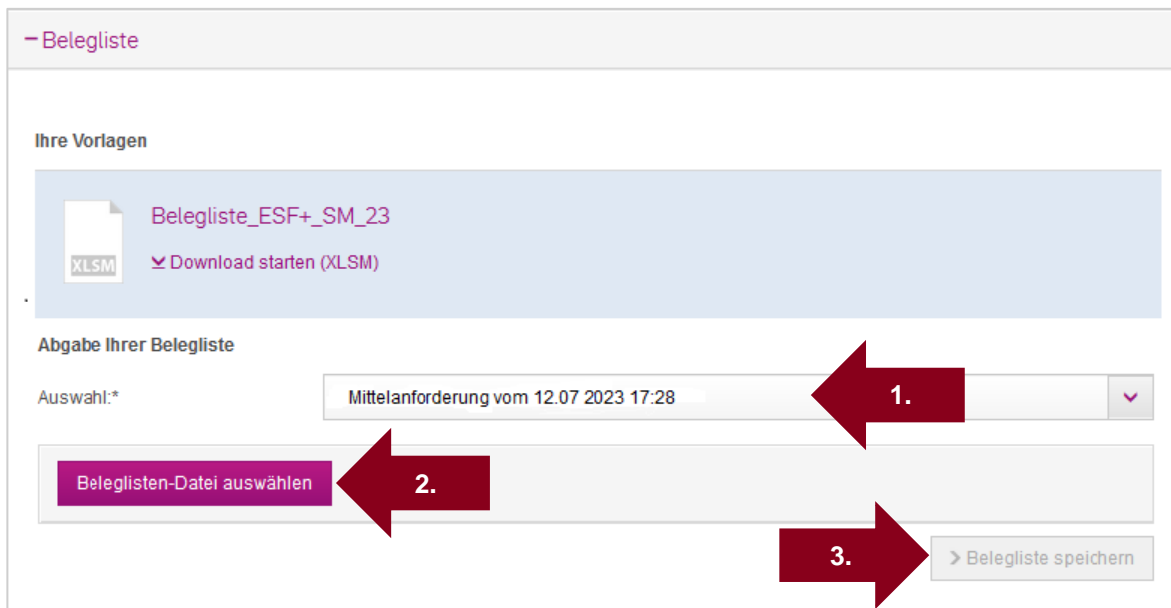
Abb. 6 Belegliste einem Vorgang zuordnen und hochladen

Im Abschnitt „Belegliste“ erscheint nun unten eine Tabelle mit allen Vorgängen, zu denen eine Belegliste erforderlich oder bereits abgegeben worden ist (Abb. 6). Lassen Sie sich nicht davon irritieren, dass Mittelanforderungen dort nun als „ZVN“ bezeichnet sind, sondern orientieren Sie sich einfach am Einreichdatum. Das Hochladen der Belege wird in ZuMA als ein Bearbeiten der Belegliste bezeichnet.