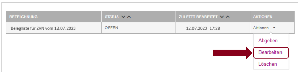
Abb. 5 Ansteuern des Uploads von Belegen

Im Abschnitt „Belegliste“ erscheint nun unten eine Tabelle mit allen Vorgängen, zu denen eine Belegliste erforderlich oder bereits abgegeben worden ist (Abb. 6). Lassen Sie sich nicht davon irritieren, dass Mittelanforderungen dort nun als „ZVN“ bezeichnet sind, sondern orientieren Sie sich einfach am Einreichdatum. Das Hochladen der Belege wird in ZuMA als ein Bearbeiten der Belegliste bezeichnet.